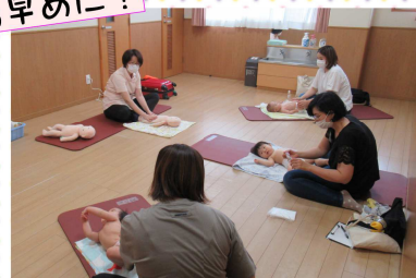
ベビーマッサージの様子

6月15日(木)に参加されたお子さんは、生後5ヶ月、7か月、11ヶ月の赤ちゃんたちでした。お母さんに優しくマッサージをしてもらって、どの子も嬉しそうでした。