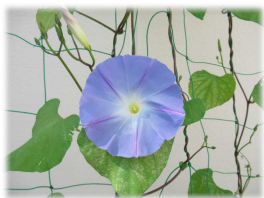
玄関の朝顔が花を咲かせました。

雨の合間の晴れた日には夏の日差しが降り注ぐようになりました。梅雨はまだ続くようですが、時折顔を見せるお日様が夏の訪れを感じさせます。夏に備えて十分な栄養、睡眠を確保して健康第一に、ワクワク楽しい夏を迎える準備をしましょう。