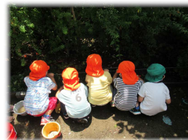
「だんごむし、どこかな」虫探しに夢中です。