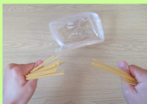
①早ゆでパスタを半分に折って袋に入れる。