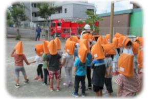
防災頭巾を被って園庭に避難

9月1日は防災の日です。保育園では、関東大震災が起きたこの日に合わせて、毎年園児の引き渡し訓練を行っています。職員と子どもたちだけでなく、保護者の方々にもできる限り参加参加していただいて、いつでも起こるか分からない災害に備えています。