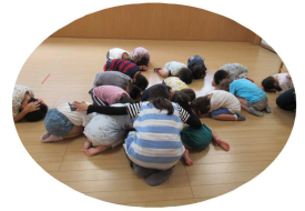
地震で揺れている間は、ダンゴムシのように丸くなって、自分の身を守ります。

もしもの時がいつ来ても柔軟に対応できるように、各ご家庭でも話し合い、過去に起こった大震災のことを忘れずに、しっかり備えをしておきましょう。