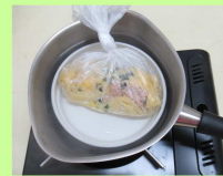
④鍋底に皿を敷き、水を入れて火にかける。

沸騰したら、③を入れてパスタが柔らかくなるまで加熱する。パスタが入った袋は、途中で上下に返す。