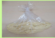
②袋に水200mlを加え30分おく。