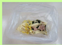
③その中へ全ての材料をいれる。空気を抜きながら、口の上の方で結ぶ。