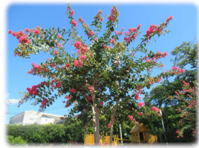
園庭の百日紅の花が満開です。