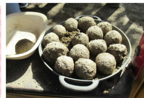
5歳児が作った砂団子

木々の葉が紅葉して秋の深まりを感じられるようになりました。保育園の砂場では子どもたちが落ち葉を使ってケーキを作って遊んだり、お友だちと一緒に山を作ったり、お団子を沢山作ったりしています。5歳児の子が上手に作ったお団子を2歳児の子がうらやましそうに見ていると、そっと1つ分けてあげる場面もありました。11月11日(土)12日(日)に石川市民センターで行われる「文化祭」には、園児の作品も展示されます。どうぞ足をお運びください。