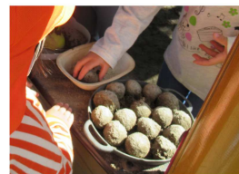
「おだんご ちょうだい」

木々の葉が紅葉して秋の深まりを感じられるようになりました。保育園の砂場では子どもたちが落ち葉を使ってケーキを作って遊んだり、お友だちと一緒に山を作ったり、お団子を沢山作ったりしています。5歳児の子が上手に作ったお団子を2歳児の子がうらやましそうに見ていると、そっと1つ分けてあげる場面もありました。11月11日(土)12日(日)に石川市民センターで行われる「文化祭」には、園児の作品も展示されます。どうぞ足をお運びください。