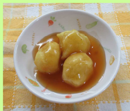
<みたらしさつまいも団子>