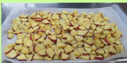
保育園のおやつのはつまいも、油で揚げないで蒸し焼きをしています。