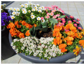
春の花は彩り豊かで、 見てるとワクワクします。