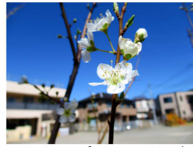
園庭のプラムの花が 咲きました。