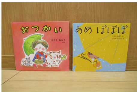
「おつかい」「あめぼぼぼ」

毎日雨がが続くと気持ちも沈みがちですが、お子さんと一緒にお気に入りの絵本を探しに出かけたり、好きなお茶でも飲みながら絵本の世界を楽しむのもいいかもしれません。暑くなる前のこの時期だからこそ、ちょっとゆっくり過ごしたいものです。多摩小ばと保育園の「こばと文庫」にも、この時期ならではの絵本が並んでいます。地域の方にも貸し出ししていますのでどうぞ遊びに来てください。