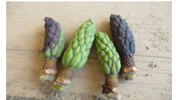
何の実? 「モクレン」です

紫陽花の花が咲き始め目を楽しませてくれます。雨が上がった日は、園庭にできた大きな水溜りで子どもたちが気持ちよさそうに、そして豪快に水遊びを楽しんでいます。元気な笑顔と笑い声が聞こえてくると、ワクワクします。夏はすぐそこまで来ています。暑さに負けず楽しいことを見つけながら今年の夏を乗り越えていきましょう!