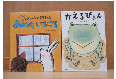
「あめのいちにち」「かえるぴょん」

この他にも、まだまだたくさんの絵本があります。どんな絵本に出会えるかな…お待ちしております。