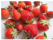
5年目の駐輪場栽培のイチゴ