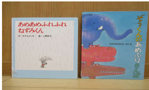
「あめあめふれふれねずみくん」「ぞうくんのあめふりさんぽ」